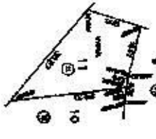
DETALLE 2 - LOTE 11 MANZANA 82B